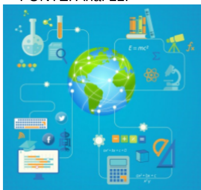
Figura 1. A imagem e o título devem estar centralizados, sendo o título em FONTE: Arial 11.

Fonte: dever ser indicada a fonte da imagem, mesmo que seja autoria própria . FONTE: Arial 11.